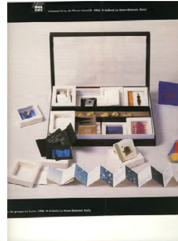
Groupe La Seine Grains de folie, 1996

L'album Un livre pour toi (Seuil jeunesse, 2004) de Kveta Pacovska, tient tout à la fois de l'objet architectural, du livre d'art et de l'exposition animée. Une cinquantaine de pages recto verso se déploient sur toute la longueur et s'observent dans tous les sens avec ses couleurs, matières à toucher, surfaces argentées en miroir, formes et découpes.