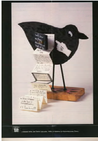
Pierre Lescault L'oiseau-livre, 1994

Le livre peut prendre la forme d'un autre objet. La boîte, la valise, le coffre, le pot deviennent réceptacles des éléments constitutifs du livre. Les pages encollées du livre constituent un bloc à sculpter, à creuser pour faire émerger d'autres signes. Contenir, enfermer, transporter, le livre devient cachette, bagage, archive. Il accueille pêle-mêle notes, écritures, images et objets. L'artiste Marcel Duchamp a conçu ainsi une Boîte verte . Il s'est exilé aux Etats-Unis muni de sa Boîte en valise , transportant à l'intérieur ses œuvres miniaturisées.