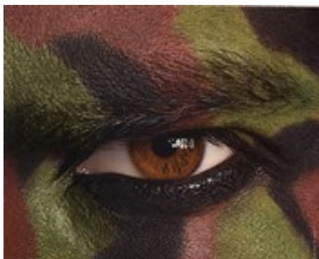
Très gros plan