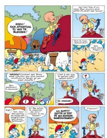
La mise en couleur