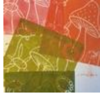
Sur plaque de linoléum