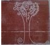
Sur polystyrène extrudé