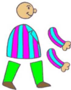
Les éléments d'un personnage en papier découpé

En papier découpé, on utilise des personnages dont chaque partie du corps est découpée dans du papier, puis articulé afin de pouvoir être disposé dans toutes les positions.