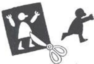
Un personnage réalisé pour un théâtre d'ombres

Les personnages et certains éléments du décor sont découpés dans un papier sombre. Le ciel, ainsi que d'autres parties du décor, sont réalisés avec des feuilles de plastique colorées transparentes. Ensuite les éléments du décor et les personnages sont posés à plat et éclairés par en dessous. Les éléments découpés apparaissent alors en silhouettes noires. On effectue ensuite le tournage sur un banc titre de la même manière que pour la technique du papier découpé.