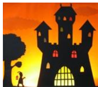
Un exemple de théâtre d'ombres