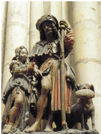
Statue de St ROCH XVIème siècle

C'est le troyen Jacques Pantaléon, devenu en 1261 ..... , qui a décidé de sa construction pour embellir sa ville. Son père était sabotier dans le quartier.