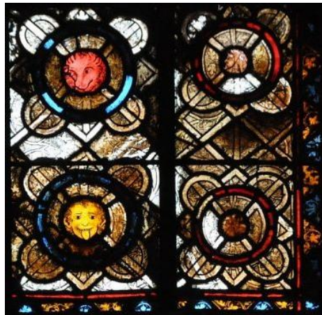
Vitraux - Grisailles, XIIIe siècle