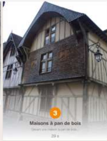
Maisons à pan de bois