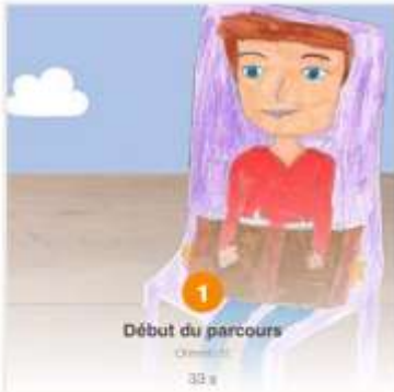
Début du parcours