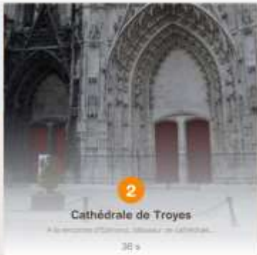
Cathédrale de Troyes

A la recherche d'Clémentine, l'élève de l'école de Troyes. 36 s